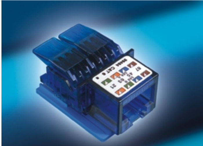
Cat.6 connection module, unshielded

Χάρη στην πολύ καλή συνεργασία με τις σχετικές επιτροπές τυποποίησης ISO/IEC, IEC και Cenelec, ικανοποιείται πλήρως η συμμόρφωση των προϊόντων Cat.6 της R&M με όλα τα ισχύοντα πρότυπα εξασφαλίζοντας στον μελετητή και εγκαταστάτη σημαντικά πλεονεκτήματα σχεδιασμού και επέκτασης. Μέχρι τέσσερις βηματικές συνδέσεις ανά γραμμή μεταφοράς μπορούν να σχεδιαστούν με το STARsystem όπως επίσης τα υλικά αυτά υποστηρίζουν όλες τις νέες καλωδιακές δομές (Open Office Cabling, Consolidation Point) μέχρι την Class E. Αυτό δίνει στο καλωδιακό σύστημα STARsystem της R&M την πλήρη