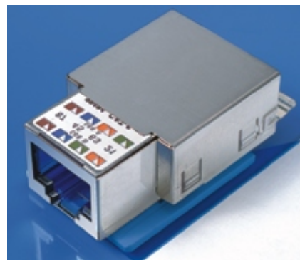
Cat.6 connection module, shielded

width αυξάνονται καθημερινά με πολύ γοργούς ρυθμούς. Το Gigabit Ethernet αναμένεται τα επόμενα χρόνια να αντικαταστήσει το Fast Ethernet φθάνοντας έως τις θέσεις εργασίας. Η IEEE εργάζεται ήδη για ένα νέο πρωτόκολλο Ethernet το οποίο θα επιτρέψει bandwidth 10 Gigabit/s στο backbone. Η επιτροπή τυποποίησης EIA/TIA αναπτύσσει ένα νέο πρωτόκολλο το οποίο χρησιμοποιεί απλούστερα ηλεκτρονικά από ότι το υπάρχον 1000BaseT και θα είναι ειδικό για το κατηγορίας 6 σύστημα δομημένης καλωδίωσης. Το πρωτόκολλο αυτό πιθανολογείται να είναι έτοιμο πολύ σύντομα.