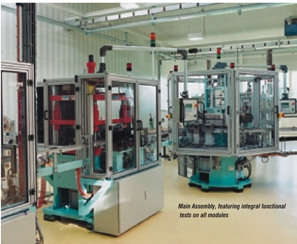
Main Assembly, featuring integral functional tests on all modules

Υπολογίζεται ότι τα Class E συστήματα δομημένης καλωδίωσης θα μπορούν να προσφέρουν ταχύτητες μεταφοράς έως 2,5 Gigabit/s ανταποκρινόμενα άνετα στις μελλοντικές εξελίξεις στους τερματικούς σταθμούς εργασίας. Ήδη οι εφαρμογές οι οποίες θα απαιτούν την ύπαρξη του Class E καλωδιακού συστήματος είναι πολύ κοντά. Ως εκ τούτου τα πραγματικά Cat.6 υλικά του καλωδιακού συστήματος STARsystem της R&M αποτελούν μια επένδυση μακράς διάρκειας και εξασφαλίζουν την συνολική αξιοπιστία του δικτύου μας.